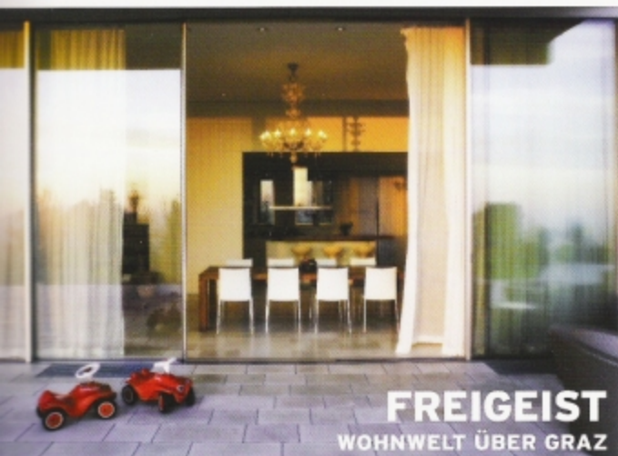
FREIGEIST WOHNWELT ÜBER GRAZ