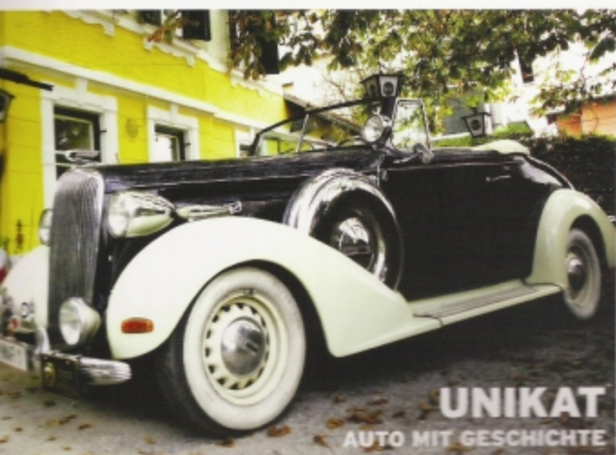
UNIKAT AUTO MIT GESCHICHTE