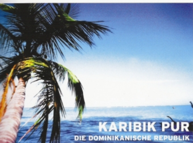
KARIBIK PUR DIE DOMINIKANISCHE REPUBLIK